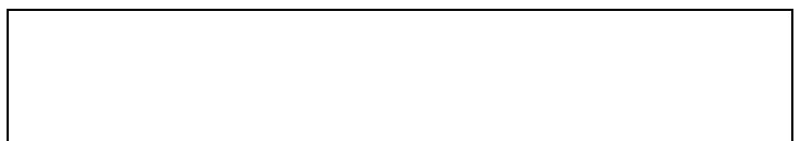
Схема границы балансовой принадлежности

е) границей эксплуатационной ответственности объектов централизованной системы холодного водоснабжения организации водопроводно-канализационного хозяйства